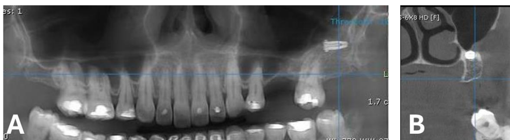
Figura 5. A. Tomografia computadorizada 24 meses após deslocamento do implante. B. Imagem tomográfica computadorizada (corte coronal) 24 meses após o deslocamento do implante. O implante é completamente circundado por osso e osseintegrado.

Esta situação pode trazer algumas dificuldades durante a instalação da cirurgia do implante, levando ao seu deslocamento para as cavidades sinusais faciais. Sgaramella et al. [4] estudaram 29 casos de implantes deslocados para o seio maxilar e observaram que diversos fatores podem levar a esta situação, como planejamento cirúrgico inadequado, experiência profissional e conhecimento dos locais anatômicos, e procedimentos cirúrgicos inadequados como superperfuração do osso com conseqüente perfuração da membrana sinusal e falta de sensibilidade durante o posicionamento do implante. Parece que todos esses critérios foram negligenciados em nosso caso, culminando com o deslocamento do implante para o seio maxilar. Talvez a melhor seqüência de tratamento no nosso caso fosse a extração do dente com instalação de coroa provisória e aguardar cerca de 2 meses para nova formação óssea. Em seguida, a colocação do implante dentário ou se necessário, um procedimento de enxerto do seio maxilar para criar uma nova estrutura óssea para estabilizar o implante e evitar a sua migração.