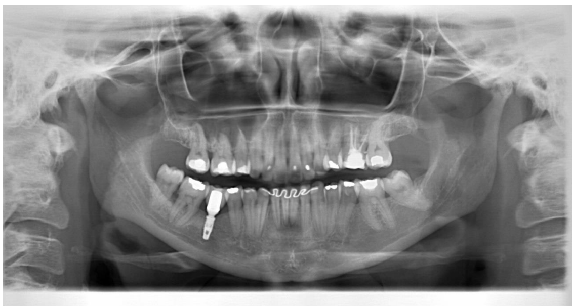
Figura 1. Radiografia panorâmica inicial utilizada para planejamento de extração do primeiro molar superior esquerdo.

O dente foi removido sem intercorrências e o osso septo preparado com 7 mm de comprimento para receber o implante em 18/04/2016 (Figura 2A e 2B). Ao final da instalação do implante, o mesmo foi deslocado para o seio maxilar devido à falta de experiência do aluno e à má qualidade óssea da região. Após diversas tentativas de retirada do alvéolo alveolar (Figura 2c) e devido ao quadro de ansiedade do paciente ele foi deixado dentro da cavidade como visto na radiografia periapical (Figura 3). Paciente foi medicado com antibióticos, analgésicos e descongestionante nasal e orientado a espirrar de boca aberta, não ingerir refrigerantes e álcool, manter dieta leve nos primeiros 5 dias e evitar alimentos quentes nas primeiras 48 horas após a cirurgia. Um dia após a cirurgia o paciente foi avaliado e realizada tomografia computadorizada (TC) demonstrando exatamente a posição do implante na região posterior do seio maxilar circundado por coágulo sanguíneo (Figuras 4A e 4B).